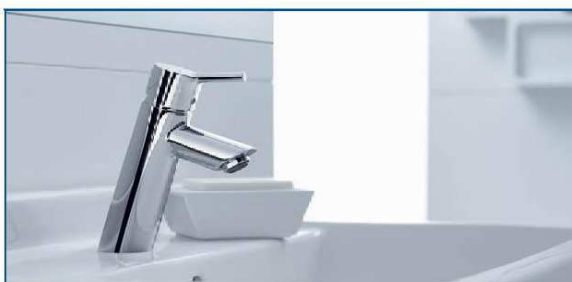
Miscelatore Grohe serie "Talis S2"

Pavimentazione in Gres Porcellanato Ditta Marazzi con caratteristiche antigelive e resistenza allo scivolamento, formati e colore a scelta della D.L.