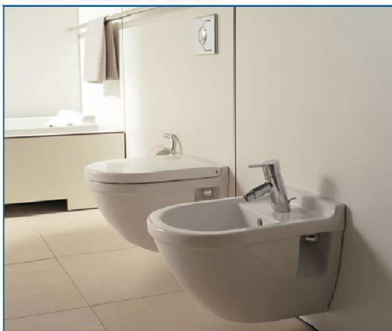
Vaso e bidet Duravit serie "Starck 3"