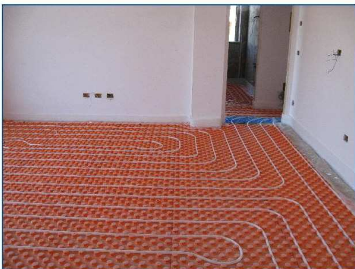
Posa pannelli radianti

Il complesso immobiliare è servito da una centrale tecnologica con pompa di calore di tipo Aria/Acqua atta a soddisfare la richiesta di energia per il riscaldamento delle singole unità abitative e la produzione di acqua calda sanitaria. L'impianto centralizzato garantisce un forte risparmio per gli utenti finali grazie a una richiesta di manutenzione ridotta ed in comune con tutti gli utenti. In più la pompa di calore, grazie al suo particolare ciclo di funzionamento, garantisce consumi ridottissimi assorbendo solo 1/3 dell'energia richiesta per soddisfare il fabbisogno dell'edificio dalla rete elettrica, mentre i restanti 2/3, vengono prelevati dall'aria esterna. Le singole unità immobiliari avranno poi dei contabilizzatori dedicati atti alla precisa suddivisione dei costi sul reale consumo effettuato e le renderanno di fatto autonome anche come regolazione della temperatura in ambiente o dell'accensione/spegnimento dell'impianto. A completamento del sopraccitato concentrato di ottimizzazione dei consumi, le unità abitative, saranno dotate di un impianto di riscaldamento/raffrescamento del tipo a pannelli radianti a pavimento per garantire il massimo del comfort ambiente e del risparmio energetico.