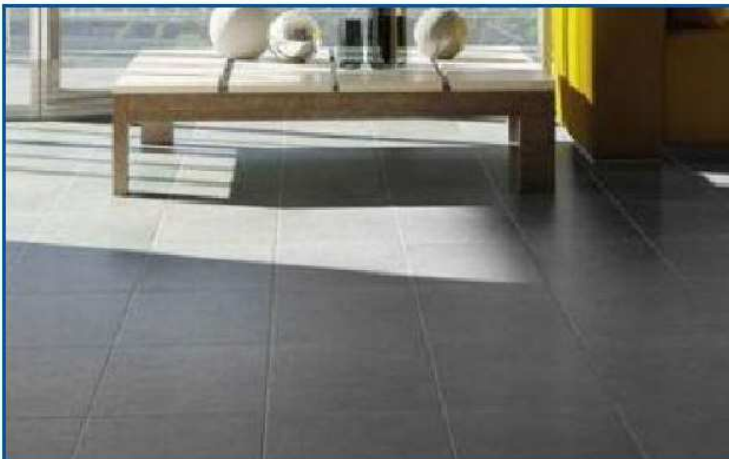
Marazzi serie "Iside" colore grigio 60x60