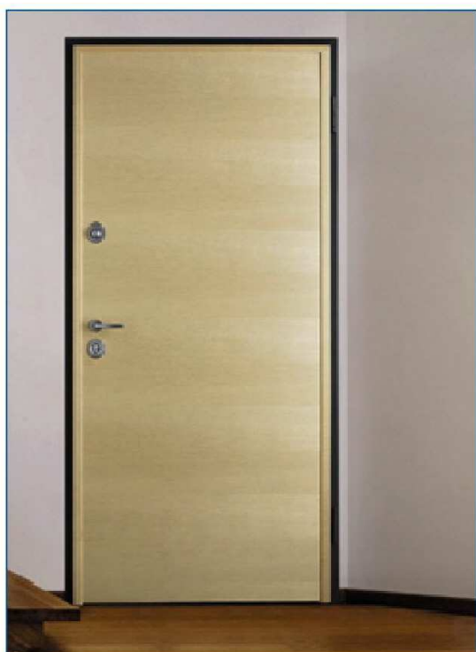
Porta blindata Torterolo & Re serie "Confort"

Le tapparelle saranno coibentate e motorizzate.