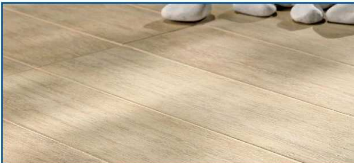
Marazzi serie "Habitat" colore white 12,5x50