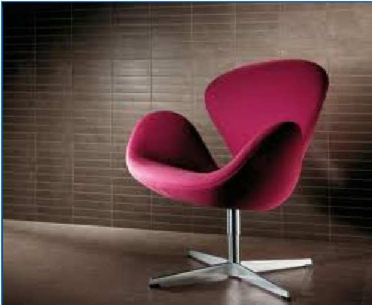
Marazzi serie "Easy" colore wenge' 20x20 + preinciso