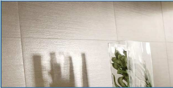
Marazzi serie "Cult" colore off white 30x60