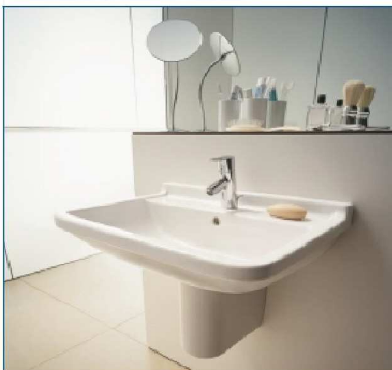
Lavabo Duravit serie "Starck 3"